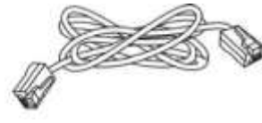
RJ-45 Ethernet Kablot)

Kablonun tipi modemün yüklendiği ülkeye bağlıdır: